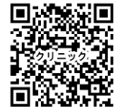
コーラスクリニック

※参加申込書は、広島県合唱連盟 Web サイト https://hiroshima-jca.org/ からダウンロードできます。