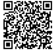
コーラスクリニック

※参加申込書は、広島県合唱連盟 Web サイト https://hiroshima-jca.org/ からダウンロードできます。