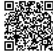
楽曲分析及び聴講

申込フォーム： https://forms.gle/wz7iBLHBy4Mn8Ew28 (楽曲分析及び聴講) https://forms.gle/tZTx75FYbStGj7Fd7 (コーラスクリニック)