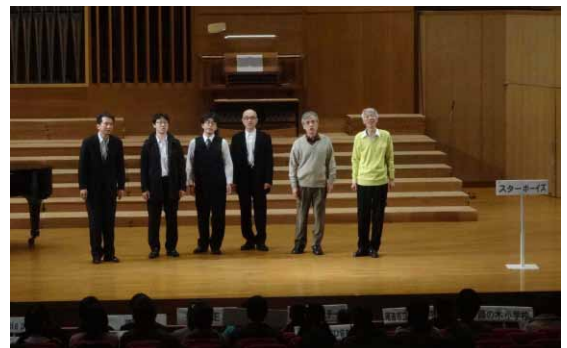
前回大会「スターボーイズ」のグランプリ演奏

参加申し込み締め切りは2015年1月18日(日)24:00です。参加希望団体が予定数を越えた場合は、申し込み順などを参考に連盟で選考させていただきます。お早めの申し込みをいただきますようお願いいたします。多数のお申し込み、そしてご来場をお待ちしております。